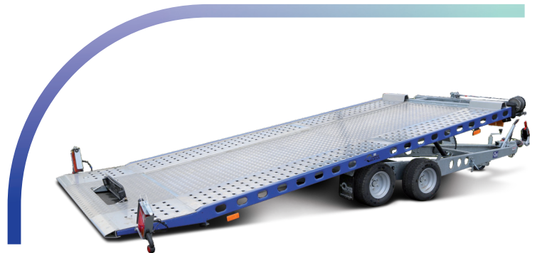
Merkur mit Riffelblech