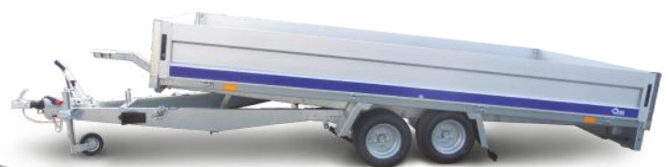
Sonda mit Bordwand