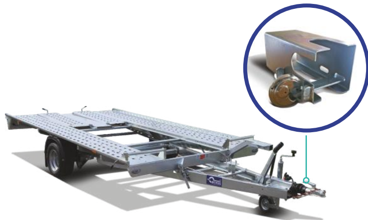
Sonda mit Diebstahlsicherung