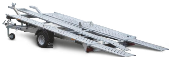
Sonda I Trike