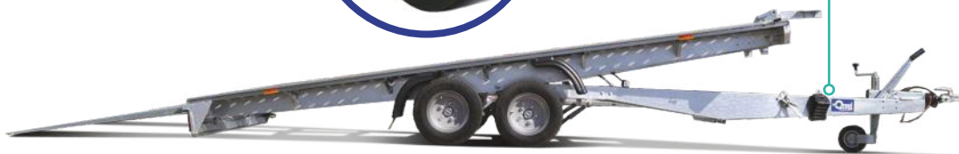
Sonda mit Reserverad