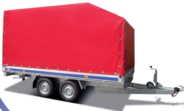
Columbia mit aerodynamischer Plane