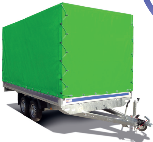
Columbia mit Hochplane