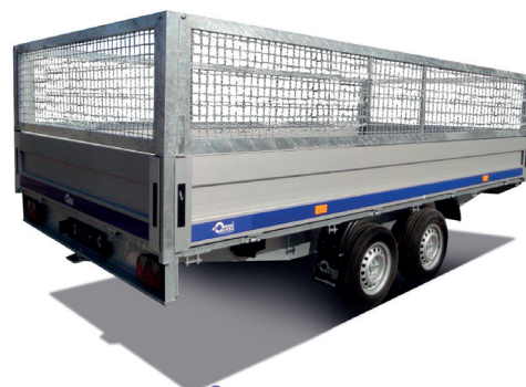
Columbia mit Laubgitteraufsatz