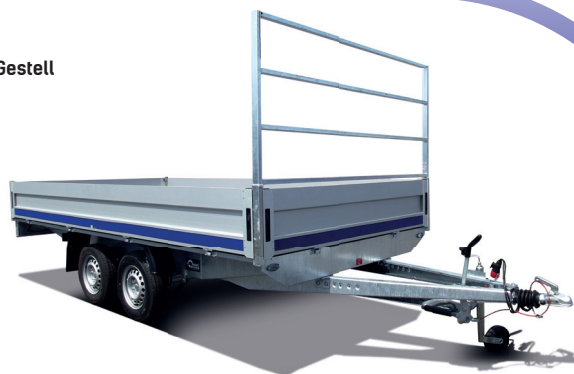
Columbia mit H-Gestell