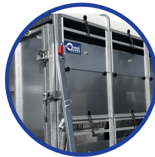
viele Lüftungsöffnungen für gute Durchlüftung