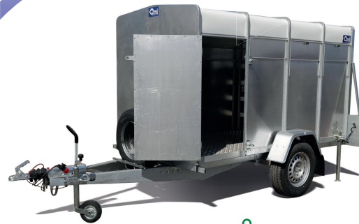
Eingangstüre vorne links