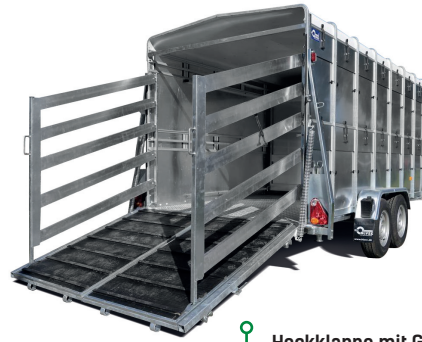
Heckklappe mit Gummibelag