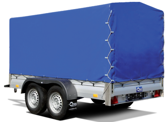
Plane mit Spiegel