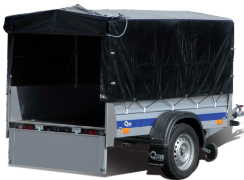
Plane 100 cm