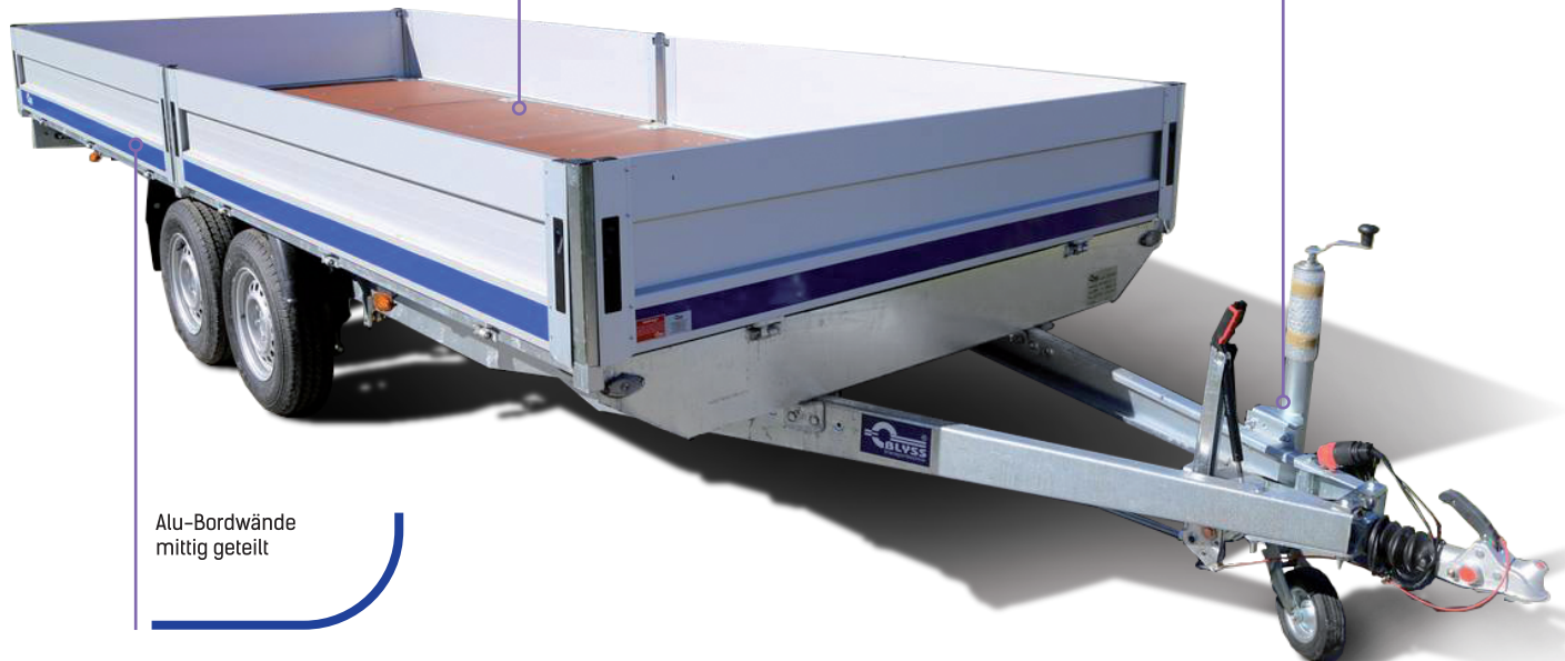
Alu-Bordwände mittig geteilt