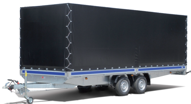
Atlantis Plane 200cm