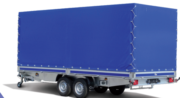
Discovery Plane 200cm