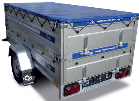
Anhänger mit Bordwanderhöhung und Flachplane