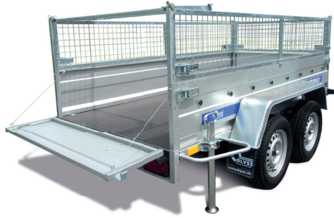
Anhänger mit Laubgitteraufsatz