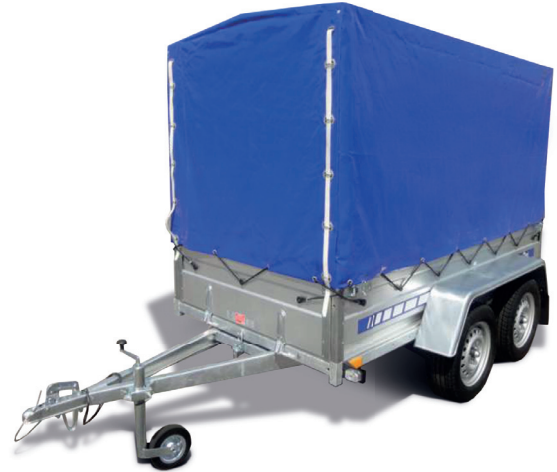
Plane mit Spriegel