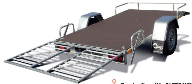
Quadaufbau (für BL752413)